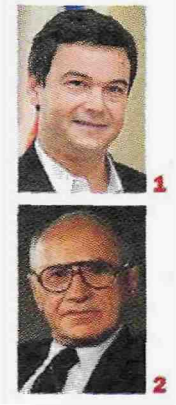
Thomas Piketty (1) autore del "Il Capitale nel XX secolo", contro le politiche liberistiche dei governi e delle teorie economiche di Milton Friedman (2)